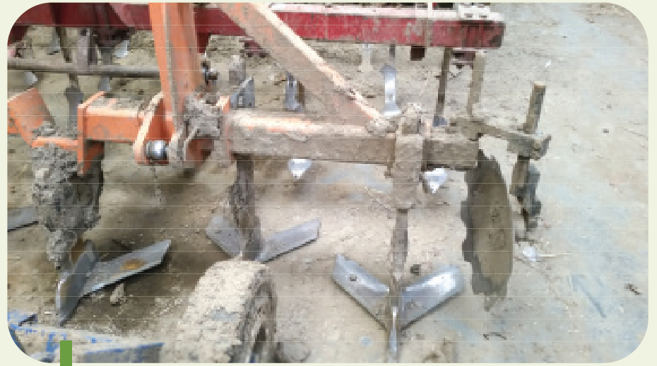
Figure 10: Décompacteur avec des dents montées en alternance sur une barre.

Un argument fréquemment avancé en faveur de la technique du travail du sol sans labour est la présence résiduelle de restes de culture à la surface du sol. Ces résidus de culture sont favorables à une moins grande sensibilité de la surface du sol à l'érosion éolienne et à la battance du sol lors de précipitations intenses. Cependant, les exigences très spécifiques du lit de semis en chicorée ne sont pas compatibles avec une présence importante de résidus de matière organique à la surface du sol. La raison principale est un placement très superficiel des graines et la nécessité d'incorpo