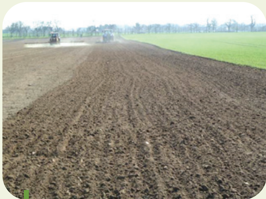
Figure 6: Il est essentiel de limiter le laps de temps entre l'application du Bonalan et son incorporation en travaillant le sol suffisamment en profondeur (8 à 15 cm).

L'application de Bonalan avant le semis est une pratique courante en culture de chicorée pour obtenir un bon contrôle du chénopode et des graminées entre autres. Cet herbicide photolabile nécessite une application adaptée. Il est recommandé d'incorporer le Bonalan immédiatement après son application afin d'éviter sa dégradation par les rayons du soleil. Le producteur recommande d'incorporer le produit à une profondeur de 8 à 15 cm, en combinaison avec un travail croisé. L'application idéale se réalise en absence de lumière solaire et en conditions humides. Du