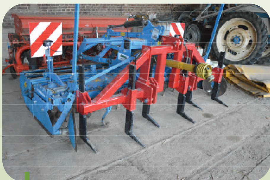
Figure 13: Luc a choisi un décompacteur avec des dents échelonnées sur une barre. Il peut le monter sur une herse rotative.

afin qu'il soit détruit par le gel. Quelques jours avant l'application de la fumure au printemps, j'effectue un traitement avec du Round-up. Juste après l'application du fumier, j'effectue une pulvérisation avec du Bonalan. De cette façon, je peux incorporer le Bonalan en même temps que le fumier. J'utilise une canadienne pour incorporer à 8 à 9 cm de profondeur le Bonalan et le fumier. Cette opération est suivie par un ou deux passages avec un kompaktor (Lemken) (aussi superficiel que possible). Un temps ensoleillé est une condition nécessaire. Si ce n'est pas le cas, les restes de l'engrais vert ne sont pas assez secs et sont trop flexibles, ce qui cause des problèmes avec la préparation du sol et le semis. J'ai pour le moment quelques problèmes avec le semis. Je vois que quelques graines restent encore en surface ».