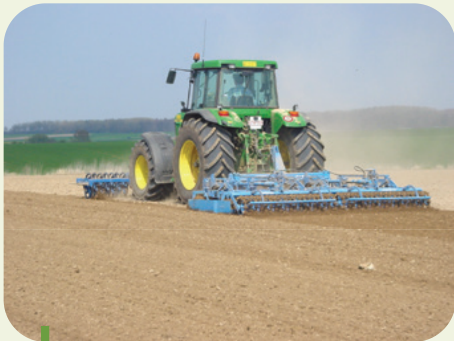
Figure 4: Outil non-animé avec dents, rouleaux émietteur et rouleaux plombeur.

Il faudra tenir compte autant que possible des prévisions météorologiques. La chicorée sera idéalement semée juste avant une période de faibles précipitations. Selon les circonstances, la profondeur de semis variera entre 0,5 cm (lit de semis fin et humide) et 1 cm (sol moins fin et plus sec). Afin de maintenir parfaitement ces profondeurs, un lit de semis plat avec suffisamment de terre fine au-dessus et une couche de sol sous-jacente suffisamment ferme est d'une grande importance. Les outils utilisés devront permettre de semer la chicorée de façon aussi précise que possible. Les éléments doivent être suffisamment lourds pour régler une profondeur constante de semis et les graines doivent être positionnées avec précision (socs en bon état) et bien plombées. L'objectif est d'atteindre 170.000 plantes par hectare. Des populations trop faibles se traduiront par des racines plus épaisses, mais plus creuses et plus fragiles. Des populations trop élevées présenteront des racines dont le diamètre sera trop petit et les pertes à la récolte augmenteront (racines trop petites). Une population irrégulière sera responsable de difficultés supplémentaires lors de la récolte (réglage des machines).