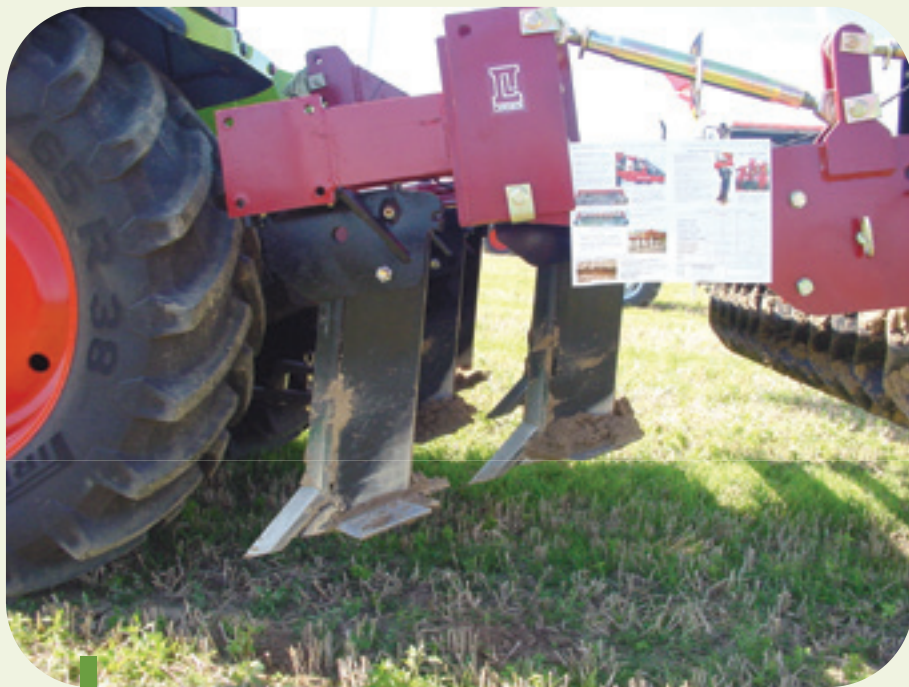
Figure 9: Décompacteur avec deux rangées de dents.

Cet essai a montré qu'un meilleur approvisionnement en eau du sol est un élément positif pour le développement de la chicorée. Mais tout n'est pas gagné avec cet avantage ! Comme observé dans d'autres cultures, la technique TSL présente aussi quelques inconvénients majeurs. Il n'est pas toujours facile de réaliser un décompactage profond correct après la récolte du précédent. L'utilisation d'outils non adaptés et/ou effectuant un travail profond du sol en conditions trop humides peut s'avérer beaucoup plus dommageable. Un décompacteur idéal se compose de plusieurs rangées de dents constituées de fines lames et d'un rouleau ou de roues de jauge permettant de régler correctement la profondeur de travail. Avec un tel outil, les zones comprimées sont décompactées sur toute la largeur de travail en évitant la formation de cavités ou de zones lissées.