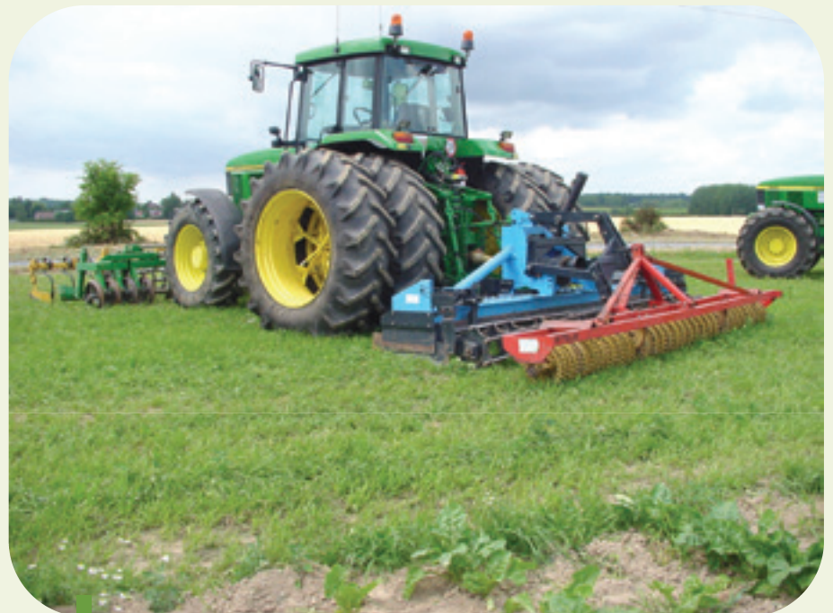
Figure 3: Herse rotative avec rouleau plombeur.

La chicorée est très sensible au stress hydrique durant les premières semaines qui suivent sa mise en terre (petite graine avec peu de réserves). Par conséquent, il est important d'assurer un bon approvisionnement en humidité. Ceci peut être obtenu en évitant un travail trop profond du sol au printemps. Un travail trop profond du sol desséchera le lit de semis en perturbant la capillarité du sol et donc son approvisionnement en eau. Selon les conditions du sol, on utilisera des outils animés (herse rotative, houe rotative) ou non-animés (combinaison de machines à rouleaux). Lors de la préparation du lit de semis, il faudra s'assurer que le sol soit suffisamment tassé pour que son approvisionnement en humidité ne soit pas compromis.