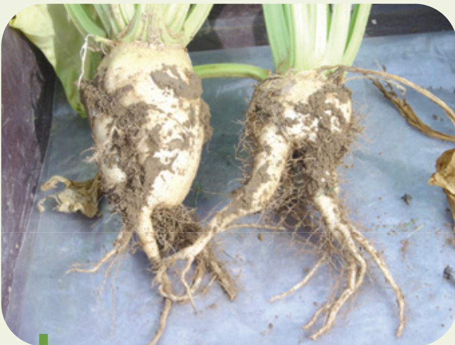
Figure 1: Racines fourchues de betterave. Des couches compactées et des cavités provoquent des racines déformées ou fourchues.

Cela veut dire que, en premier lieu, la structure du sol doit être optimale. Bien qu'un sol ferme (non compacté !) convienne mieux à une racine de chicorée qu'à une racine de betterave, un sol très dense (ou compacté) sera néfaste pour le développement de la racine principale de la chicorée. Les couches compactées peuvent provoquer des racines fourchues qui induiront plus de bris de racines pendant l'arrachage. Des travaux de sol trop profonds dans un sol insuffisamment ressué formeront des cavités et des couches lissées qui auront, comme dans les zones compactées, un impact négatif sur le rendement (Figure 1).