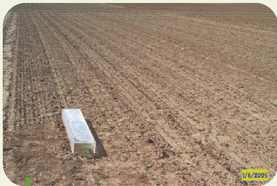
Figure 7: Mesure de l'évaporation de l'humidité du sol au moyen de boîtiers collecteurs placés dans diverses modalités de préparation du sol. Essai mis en place par Monsieur C. Roisin (CRA-W, Gembloux) en 2005.

Un essai a été mis en place en 2005 par Monsieur C. Roisin du CRA-W (Gembloux) où différents types de travail du sol sans labour (TSL) ont été comparés avec différentes techniques traditionnelles (avec labour). Le précédent était une céréale, paille hachée, sans engrais vert pour limiter l'apport de matière organique à la surface du sol. Le Bonalan a été incorporé avant le semis (à 2 à 3 cm de profondeur) dans tous les objets. Les objets en TSL ont atteint un meilleur rendement en général dans cet essai. L'explication en est que les plantes de chicorée ont profité d'un meilleur état d'humidité du sol dans les objets TSL. En effet, la perte d'humidité du sol a été mesurée dans les différents objets de cet essai (Figure 7).