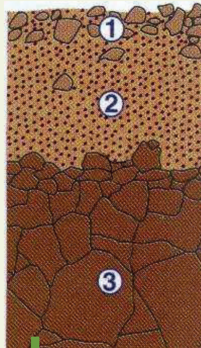
Figure 2: Caractéristiques d'un bon lit de semis.

Les graines de chicorée sont très petites et contiennent peu de réserves nutritives. Par conséquent, il est très important de créer un lit de semis qui soit optimal pour que les graines germent rapidement, sans éléments de stress. Il ne peut y avoir trop de problèmes au risque d'observer une mauvaise levée. L'exigence de base pour un bon lit de semis en chicorée est que la surface du sol soit parfaitement plane, avec juste assez de terre fine au-dessus et avec une couche sous-jacente à la raie de semis qui soit suffisamment « ferme » pour bien plomber la graine (Figure 2).