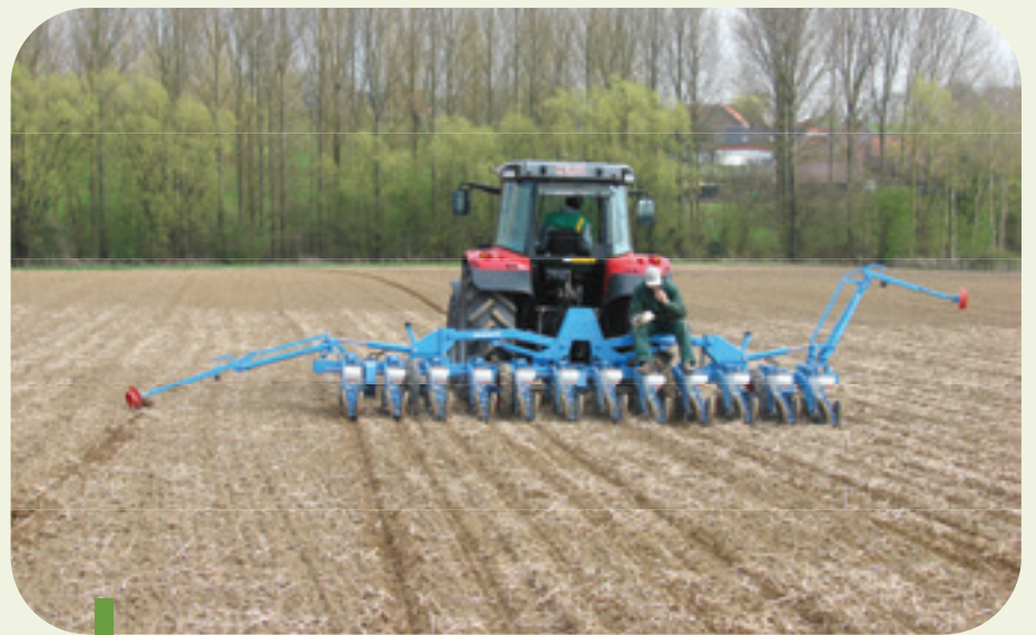
Figure 11: Le semis de la betterave sucrière s'adapte plus facilement à la présence résiduelle de matière organique à la surface du sol en effectuant un semis légèrement plus profond.

rer le Bonalan. En présence de résidus de matière organique dans la couche superficielle du sol, les graines de chicorées ne peuvent pas être semées, couvertes et plombées correctement. Il n'est pas possible, comme pour la betterave à sucre, de semer plus profondément (maximum 1 cm de profondeur). Ceci a été observé par des agriculteurs qui ont acquis de l'expérience avec la culture de la chicorée en non-labour. Suite au passage des différentes machines, il restait très peu de matière organique présente à la surface du lit de semis. Leur expérience est décrite à la suite de cet article. Un élément également important dans les résultats des essais effectués en 2005 par Monsieur C. Roisin (CRA-W, Gembloux) est qu'il n'y a pas eu de semis d'engrais vert après la récolte du précédent qui était une céréale, paille hachée. Il faut donc être particulièrement attentif lors d'un travail du sol sans labour en culture de chicorée. Pour les autres cultures, la matière organique résiduelle en surface ne constitue pas nécessairement une difficulté, ce qui est bien le cas avec la culture de la chicorée!