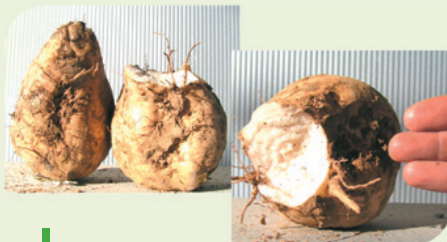
Pour la conservation à long terme, limiter au maximum la présence de betteraves avec des bris de racines équivalents ou supérieurs à 4-6 cm de diamètre (soit 3 doigts de diamètre). Ces blessures sont une très grande porte d'entrée pour le développement de pourritures de stockage qui vont rapidement dégrader la valeur et la qualité marchande de votre récolte.

En 2014, de très nombreux champs ont été arrachés fin octobre, pour être livrés en décembre ou plus tard. Ces tas de betteraves, confectionnés trop tôt, ont largement dépassé le seuil de 300 degrés jours fixé par l'IRBAB. La qualité industrielle de ces betteraves était néfaste au bon fonctionnement des usines et ont ralenti leur allure.