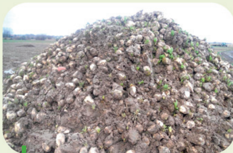
Une tare terre excessive limite l'aération du tas, empêche le dessèchement de la terre et favorise l'échauffement du tas. Tout ce qu'il y a de plus mauvais pour une conservation à long terme.