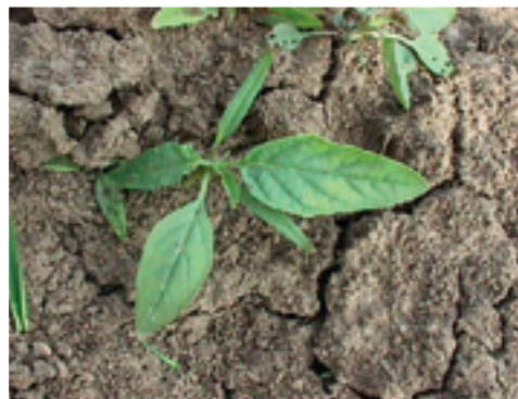
Plante de Datura (herbe aux taupes) au stade 2 vraies feuilles et plante adulte dans un champ de chicorée.